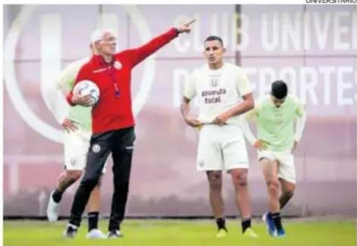
Cúper empezó su trabajo el último sábado, tras la derrota crema ante Grau.

Visita a Nacional (5 p.m.) y Cristal también se juega la vida ante Junior en Colombia (9 p.m.).