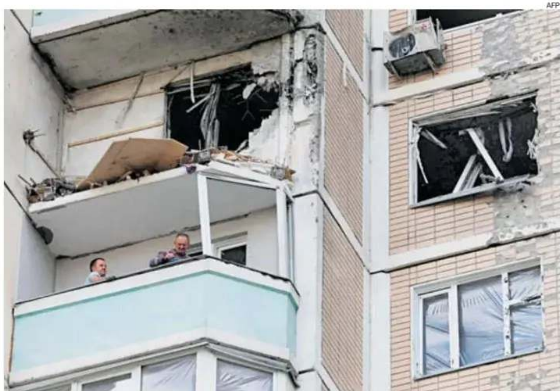
Personas inspeccionan un balcón dañado en un edificio residencial tras un ataque aéreo en Krasnogorsk, en Moscú.

A su juicio, ambos bandos atraviesan un proceso permanente de adaptación tecnológica y militar en