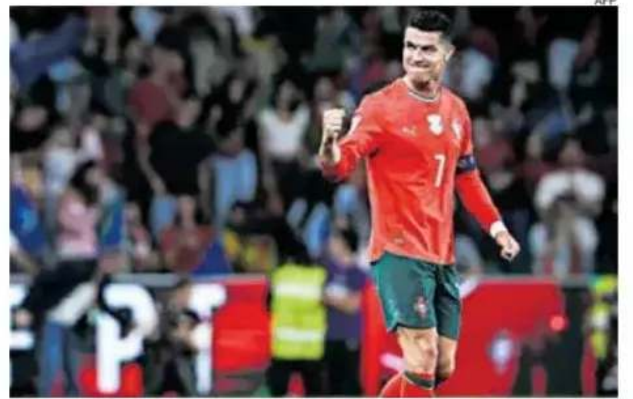
Cristiano suma tres títulos con Portugal: una Euro y dos Nations.

Mientras, Cusco FC recibe al Independiente de Medellín y debe ganarse si quiere tener opciones para llegar al menos a la Sudamericana. —