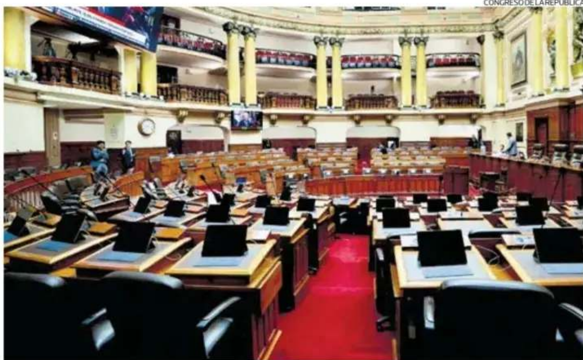
El próximo Congreso bicameral tendrá 60 senadores (son 30 nacionales y 30 regionales) y 130 diputados.

El avance de las actas contabilizadas del proceso para elegir a senadores y diputados bordeaba hasta ayer el 95%. Los jurados electorales especiales continúan resolviendo las actas observadas.