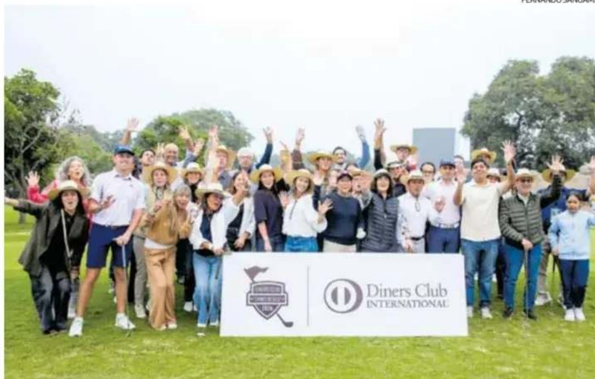
Los Socios de Diners Club Perú disfrutaron de dos eventos: el Tour 2026 y la clínica de golf con deportistas profesionales.

Diners Club va más allá del lado deportivo, y mantiene su vínculo con