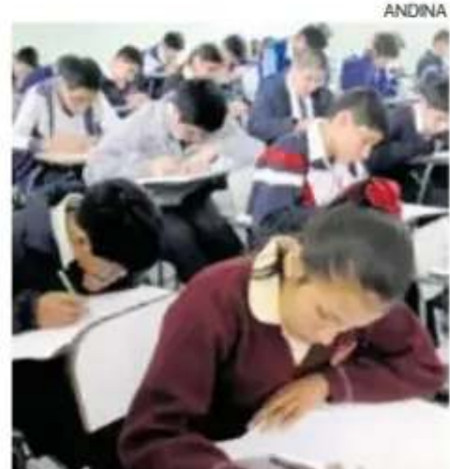
El nuevo marco normativo tendrá un enfoque "científico, biológico y ético".

La medida fue oficializada mediante una resolución viceministerial emitida por el sector Educación y se da en cumplimiento de una ley aprobada por el Congreso (Ley 32535), impulsada por la congre-