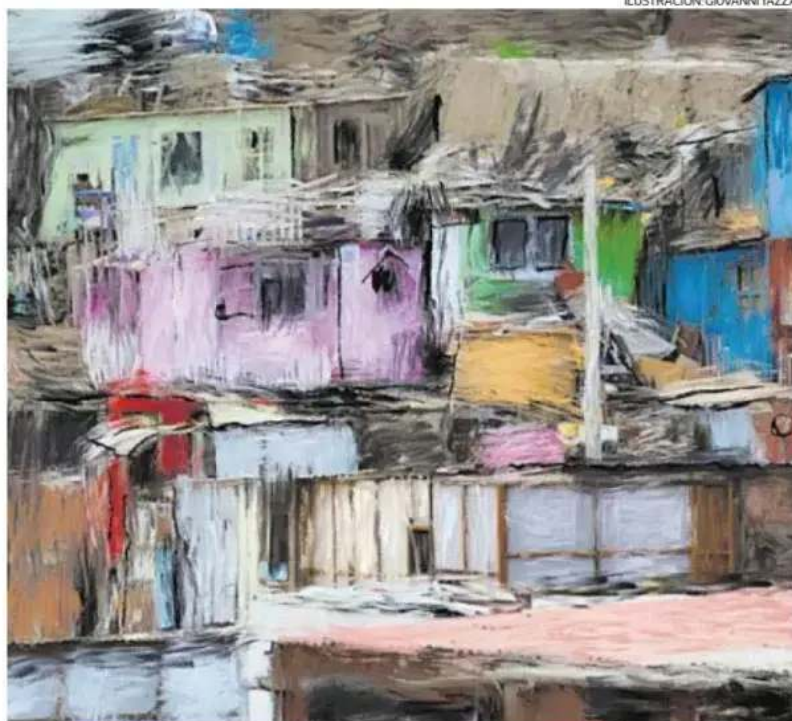
ILUSTRACIÓN: GIOVANNI TAZZA

Cuando el Estado prioriza la titulación como principal herramienta de acceso a la vivienda, las políticas orientadas a promover el desarrollo urbano planificado y la vivienda formal terminan debilitándose frente a la inmediatez política, el rédito populista y las economías ilegales que sostienen la informalidad. Durante el gobierno de Alberto Fujimori se promovieron las dos principales políticas habitacionales de las últimas décadas: la titulación a través de Cofopri y los créditos hipotecarios respaldados por el Estado mediante el Fondo Mivivienda. Según estimaciones de Grade, a 30 años de su implementación el 93% del nuevo suelo urbano del Perú es de origen informal y más del