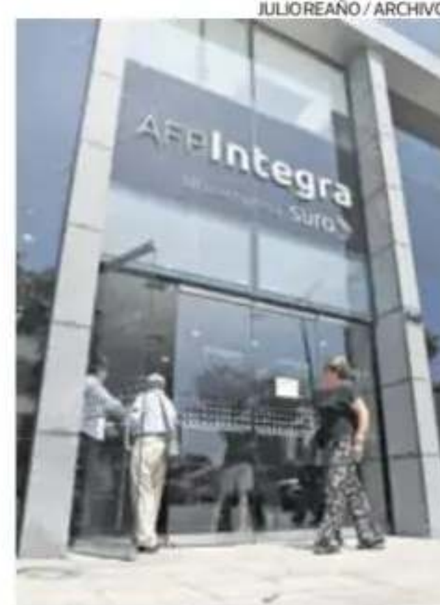
Sistema previsional reporta rentabilidad en contexto de retiros masivos.

Por otro lado, indicó que los fondos de pensiones han mostrado un crecimiento este año. Es así que el fondo 1 registra un aumento de 4,8% en su rentabilidad, el fondo 2, 11,3%; y el fondo 3, 18,4%. —