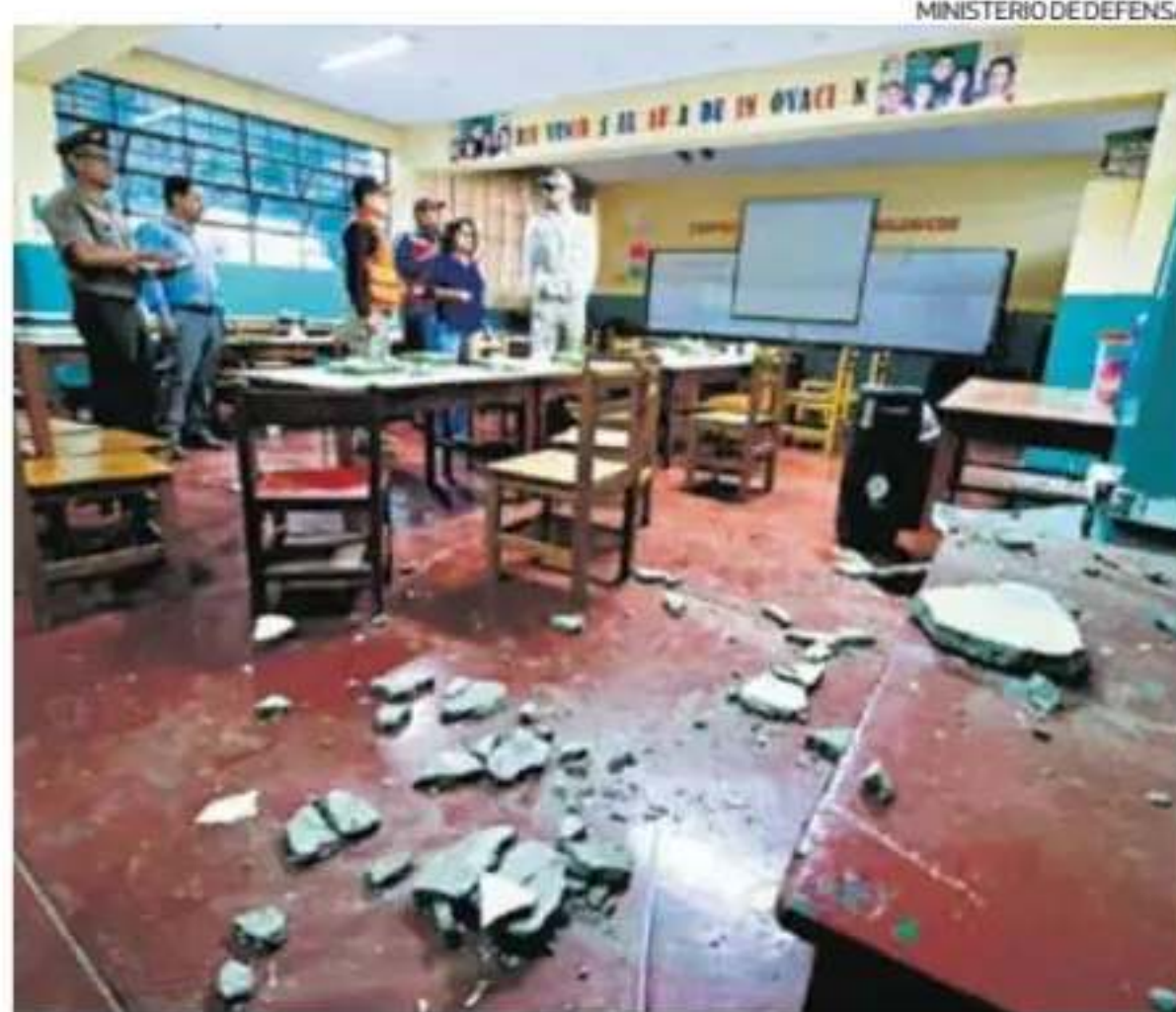
El fuerte movimiento telúrico afectó varias instituciones educativas.

El ministro de Defensa, Amadeo Flores, informó que el fuerte sismo