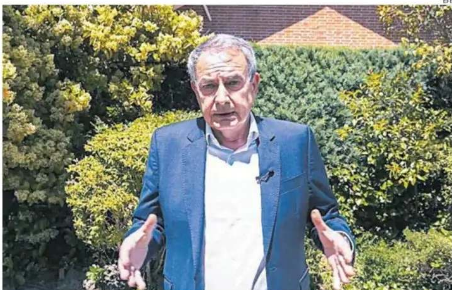
El político expresó su disposición a colaborar con la justicia, pero negó haber participado en alguna operación irregular.

Juez aduce que el exmandatario español obtuvo beneficios económicos tras aprobarse una ayuda de 53 millones de euros para rescatar a una aerolínea. Deberá comparecer el 2 de junio.