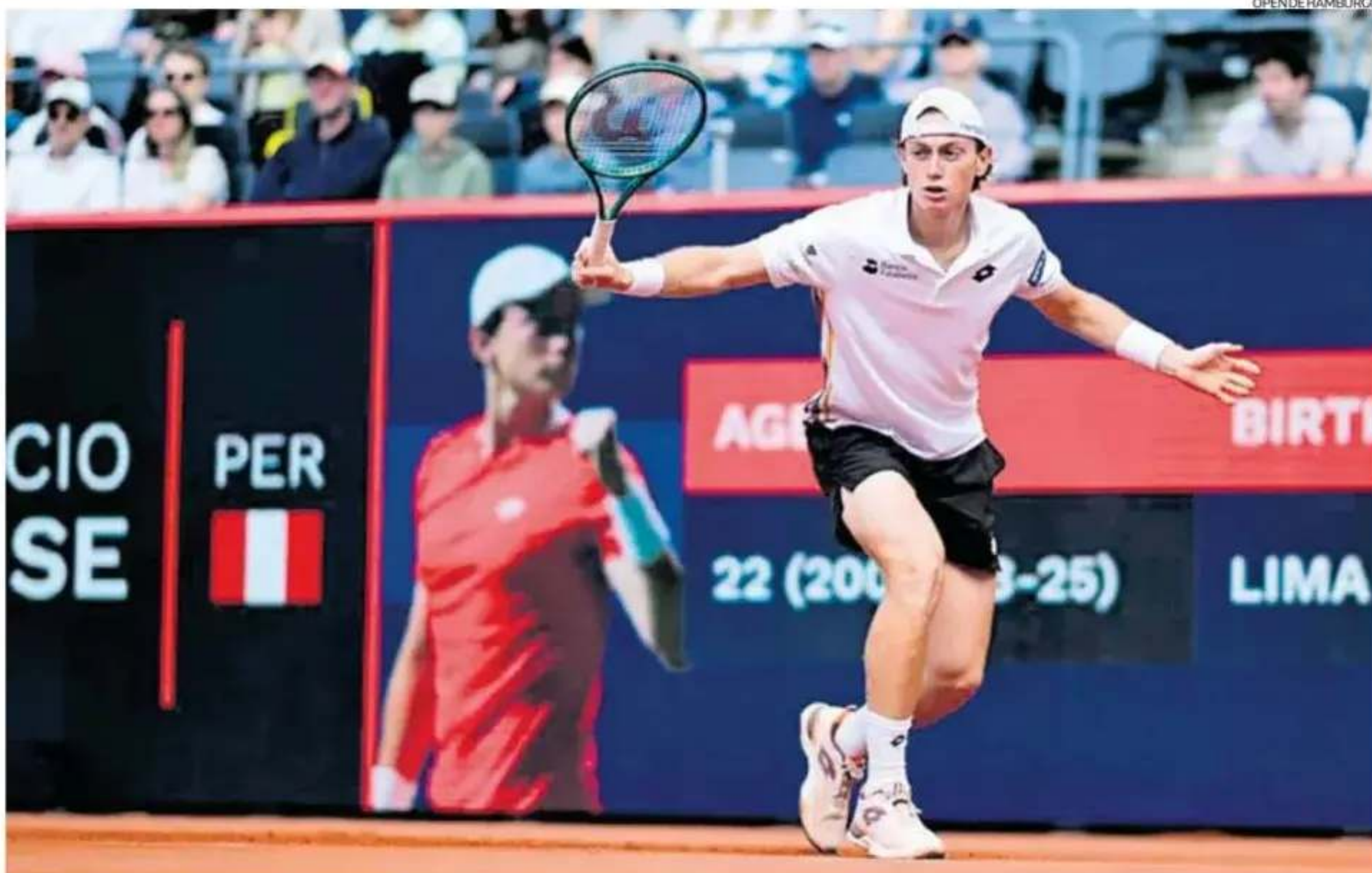
Con el puesto actual, el peruano ya confirmó su presencia en los siguientes Grand Slams, Wimbledon en junio y el US Open que empieza en agosto.