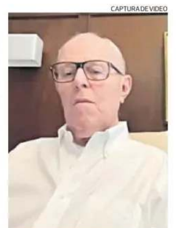
Para Kuczynski, el entorno de Roberto Sánchez no inspira confianza.