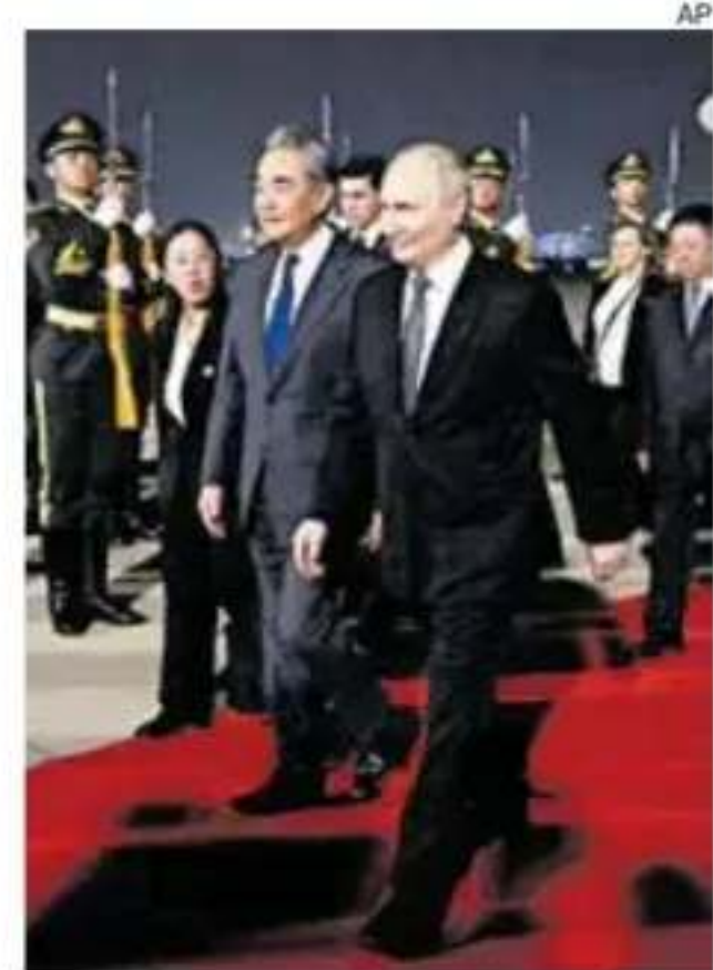
Putin es escoltado por el ministro de Exteriores de China, Wang Yi.

Uno de los principales asuntos de fondo será la guerra en Ucrania. Beijing negó ayer una información del “Financial Times” según la cual Xi dijo a Trump que Putin podría acabar “arrepintiéndose” de haber lanzado la invasión a gran escala de Ucrania.—