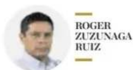
ROGER ZUZUNAGA RUIZ

PRESIÓN. El ataque récord con casi 600 aparatos no tripulados sobre la región de Moscú sugiere un cambio en el conflicto: Ucrania busca golpear la retaguardia rusa, romper la sensación de seguridad y demostrar que incluso el centro de poder ruso puede quedar expuesto.