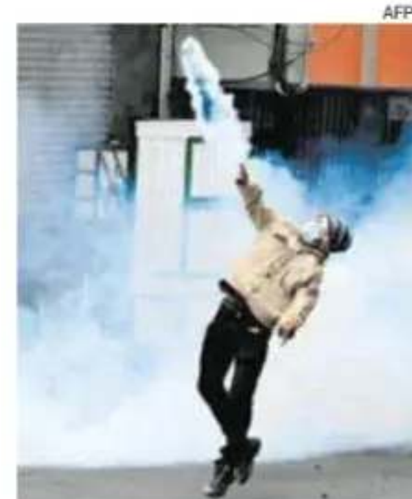
La policía detuvo a más de 127 personas por actos de vandalismo.

El actual presidente, Pedro Sánchez, y el gobierno salieron a defender el “buen nombre” de Rodríguez Zapatero y dijeron tener confianza en la justicia. Sánchez reconoció que son “momentos duros” para el PSOE. —