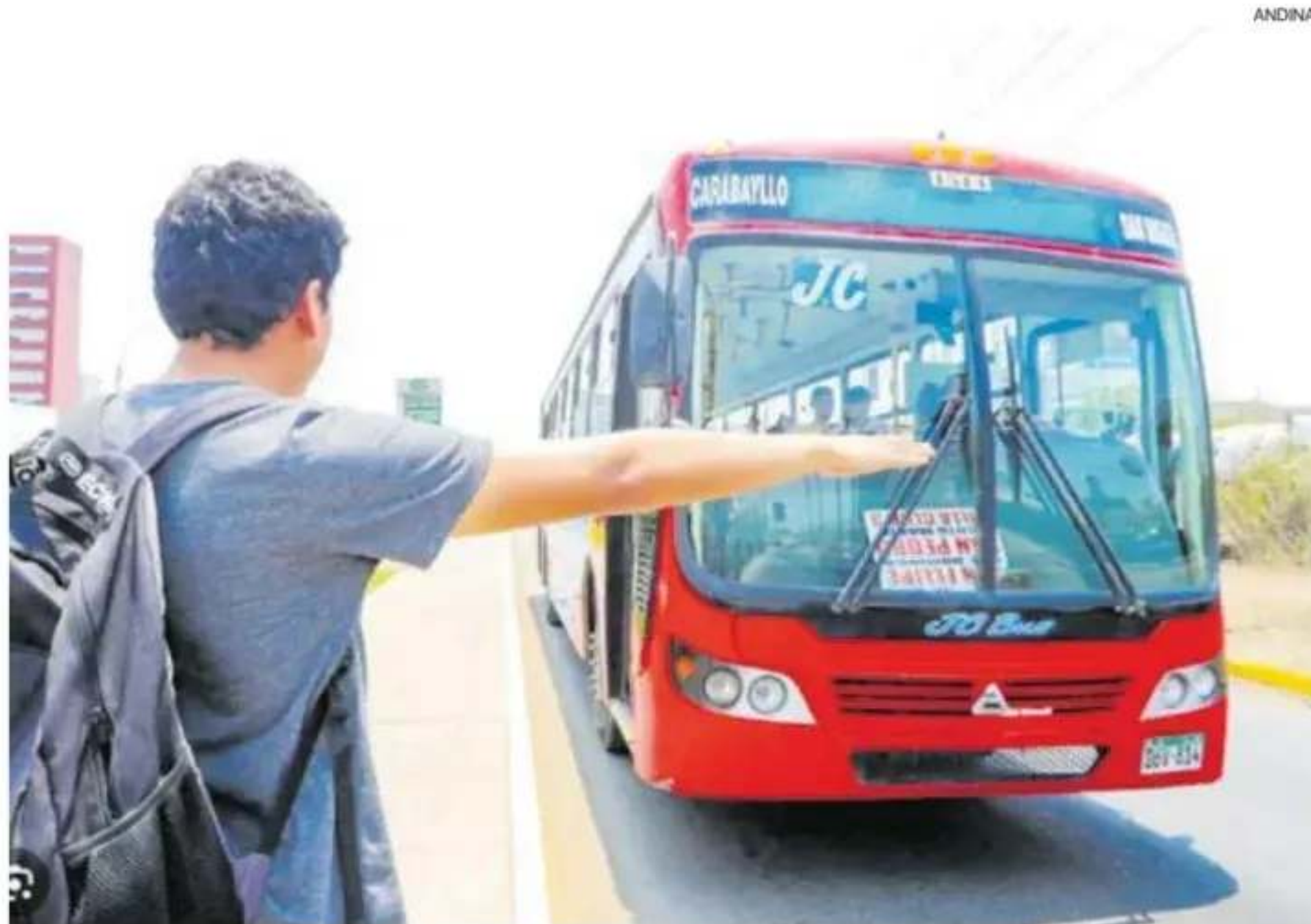
Además de la denuncia por los delitos de colusión y negociación incompatible, se presentó un recurso de nulidad.

La denuncia presentada por el consorcio SEBHEC-IDELCOMV sostiene que las observaciones persistieron incluso después de la refor-