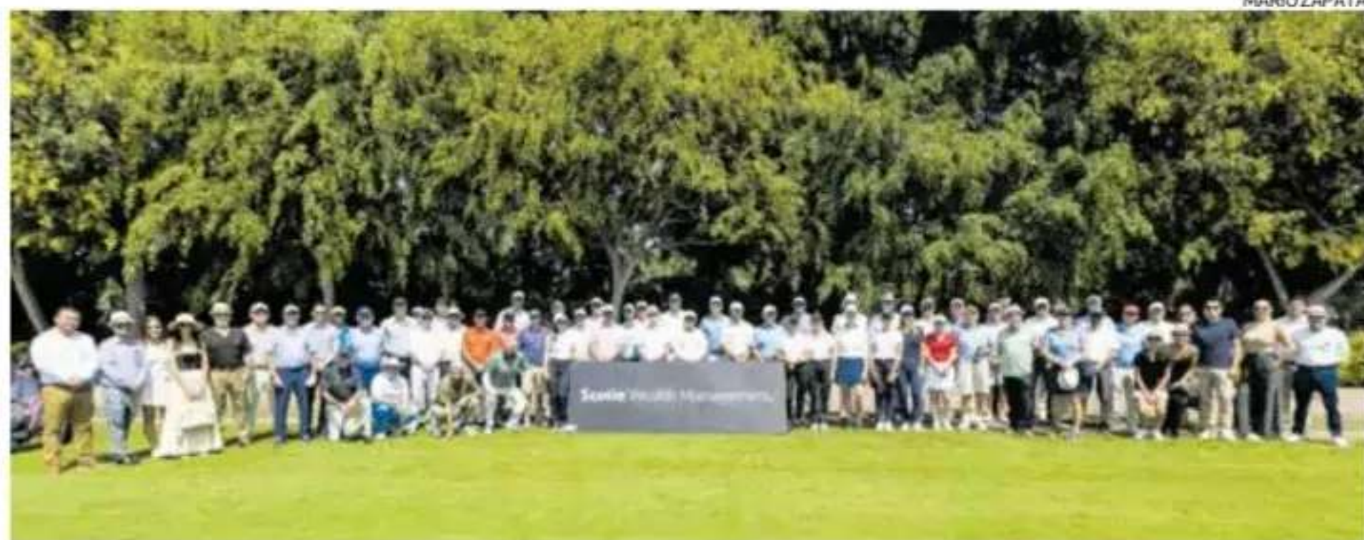
Los clientes de Scotiabank estuvieron felices de compartir los secretos del golf de mano de profesionales.

— Golpes cortos para familiarizarse con el deporte y medir su precisión, golpes largos para sentir la potencia. Así se vivió la Scotia Golf Experience, presentada por Scotia Wealth Management, que tuvo en la clínica de golf un gran momento de encuentro de sus clientes con esta disciplina.