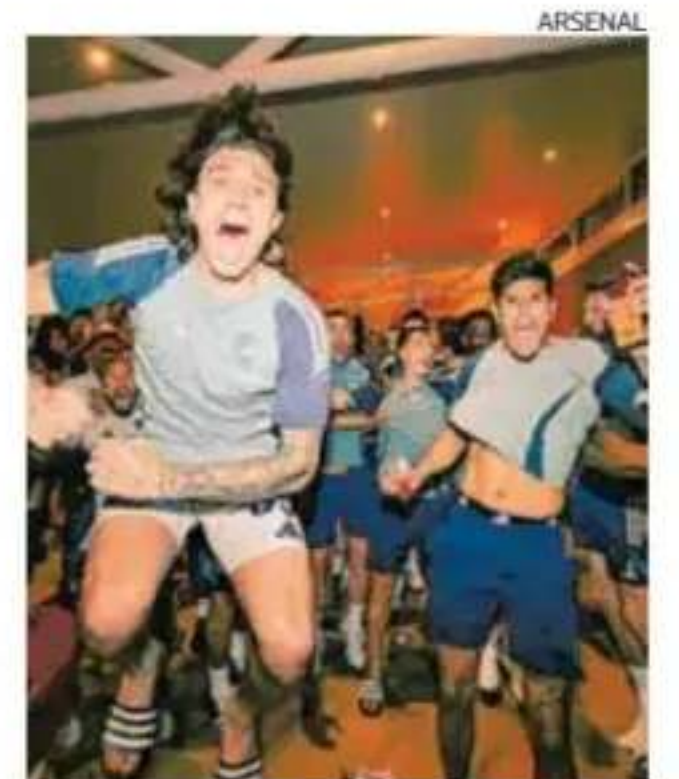
El cuadro londinense sumó su decimo-cuarto título en el torneo inglés.

Por otro lado, ayer el técnico del City Pep Guardiola aseguró que se tendrá que reunir con el presidente del club para definir si permanece en el club, aunque tiene un año más de contrato. —