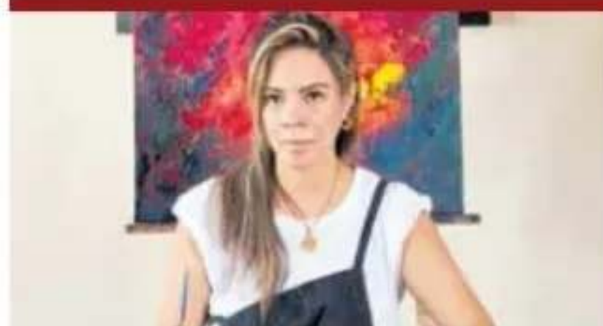
Una exposición internacional.

El teaser de la película ya se encuentra disponible en plataformas digitales. La Tribu se estrena en todos los cines del Perú el próximo 8 de octubre.