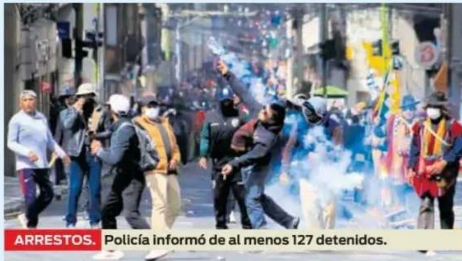
ARRESTOS. Policía informó de al menos 127 detenidos.

Uno de los casos más críticos es el de un suboficial que custodiaba una estación del teleférico en el centro de La Paz y que fue brutalmente golpeado has-