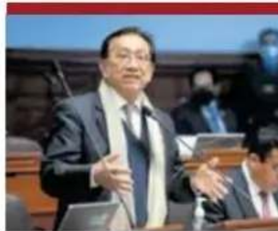
Revés para Balcázar.