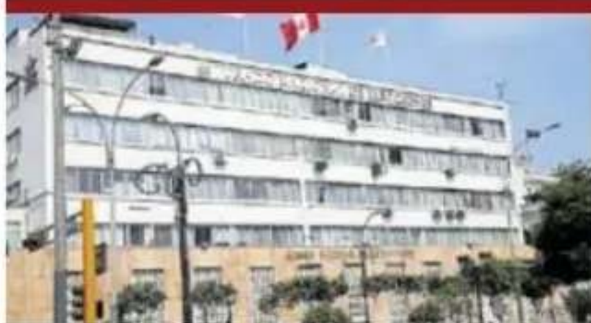
El JNE le pasa la factura a JP.