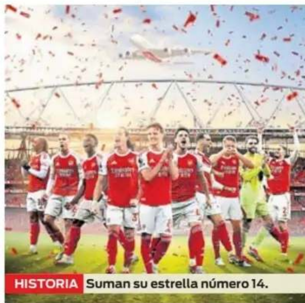
HISTORIA Suman su estrella número 14.

Así, los "Ciudadanos" solo llegaron a 78 puntos y quedaron a cuatro de los "Gunners", quienes estaban atentos en su centro de entrenamientos. Precisamente, la plantilla estuvo siguiendo el duelo de sus archirrival y explotaron de alegría al ver el beneficioso resultado.