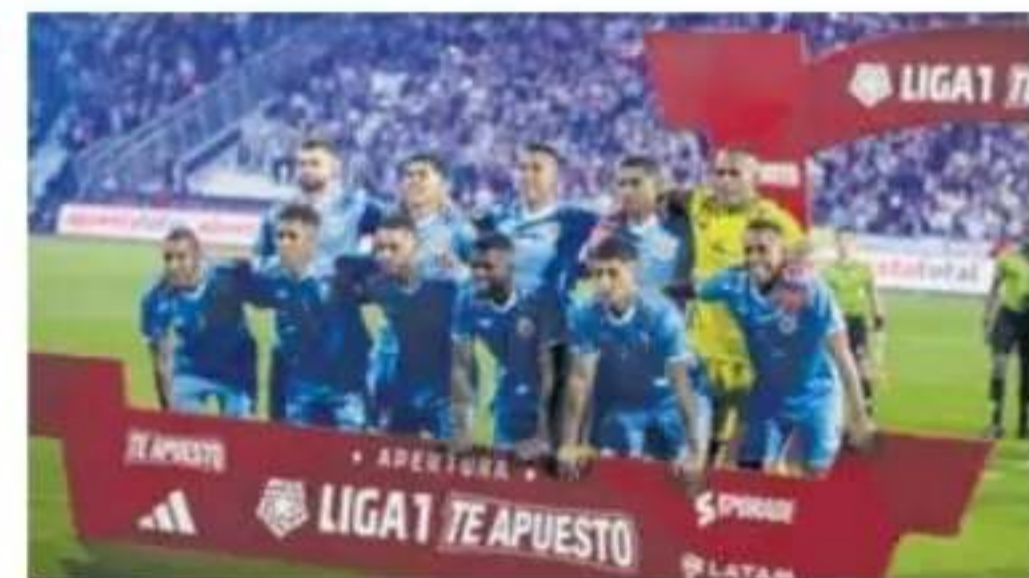
Liga 1 no pretende hacer efectiva la sentencia.