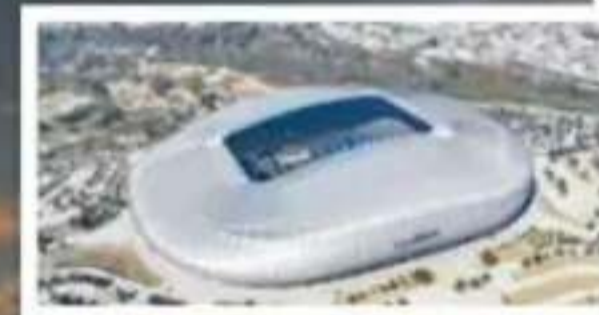
Estadio BBVA, Monterrey Capacidad: 53.500