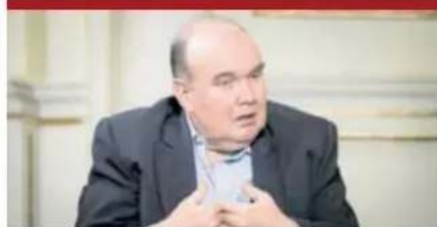
Excalde deberá declarar el 4 de junio.

y luego el mandatario o su abogado. Tras el debate entre los senadores, la vacancia requerirá al menos 40 votos para ser aprobada. Ante un eventual gobierno de Roberto Sánchez, Fuerza Popular, que sería la principal bancada de oposición y tendría mayoría en ambas cámaras -con 39 diputados y 22 senadores-, necesitaría formar una coalición con Renovación Popular, El Buen Gobierno y Obras para que prospere una vacancia. De esta manera, se alcanzarían por lo menos 40 votos en la Cámara Alta y 87 en la Cámara Baja.