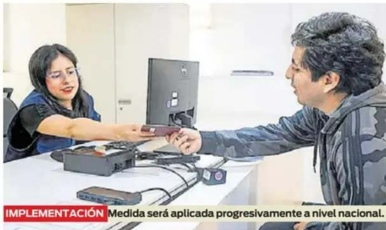
IMPLEMENTACIÓN Medida será aplicada progresivamente a nivel nacional.

» La Superintendencia Nacional de Migraciones aplicará nuevo sistema en todas sus sedes para eliminar demoras y mafias de tramitadores