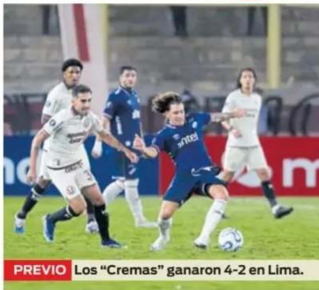
PREVIO Los "Cremas" ganaron 4-2 en Lima.

DESEO. Después de haber superado a este mismo rival en la primera rueda (4-2), la "U" tiene todo a favor: si gana, podrá definir su futuro en octavos frente a Tolima, en el Monumental; y asegurar, en el peor de los casos, el tercer lugar para ir a la Sudamericana. Un empate es beneficioso, pero no decisivo. Así las cosas, el técnico Héctor Cúper, quien debutará al mando de la institución, que-