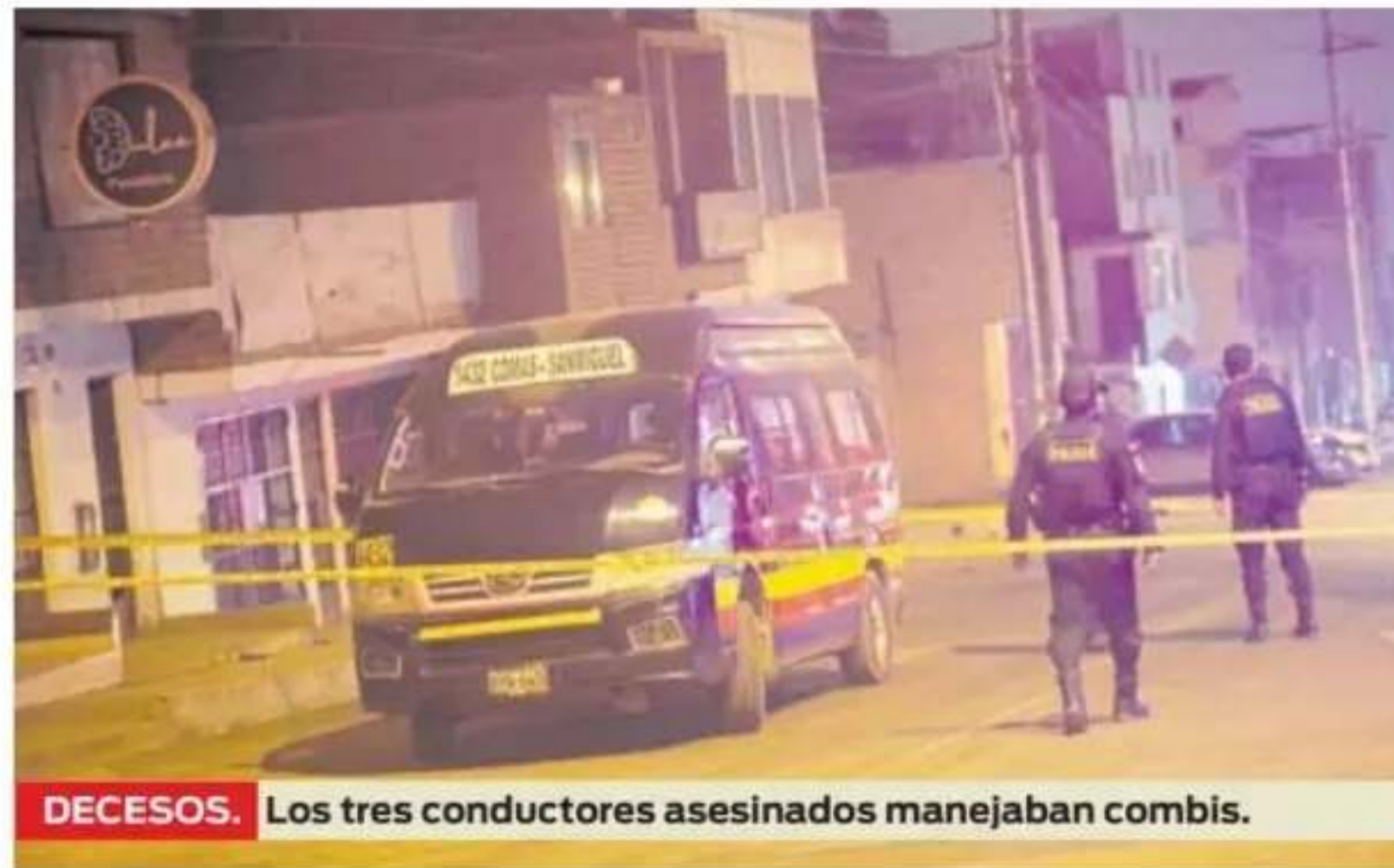
DECESOS. Los tres conductores asesinados manejaban combis.