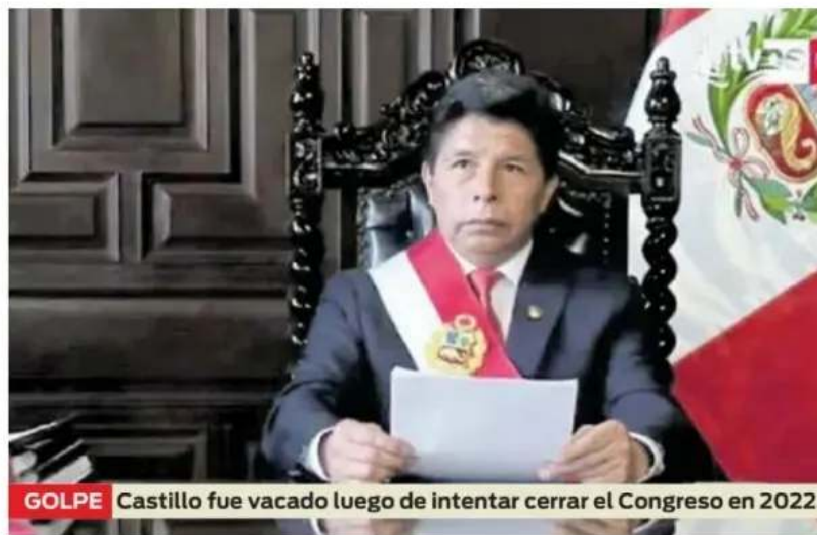
GOLPE Castillo fue vacado luego de intentar cerrar el Congreso en 2022.

ETAPAS. De acuerdo con las modificaciones aprobadas por el Parlamento en 2025, este mecanismo constitucional tendrá que pasar por dos etapas para concretarse. La primera se desarrollará en la Cámara de Diputados, integrada por 130 miembros. El proceso comenzará con la