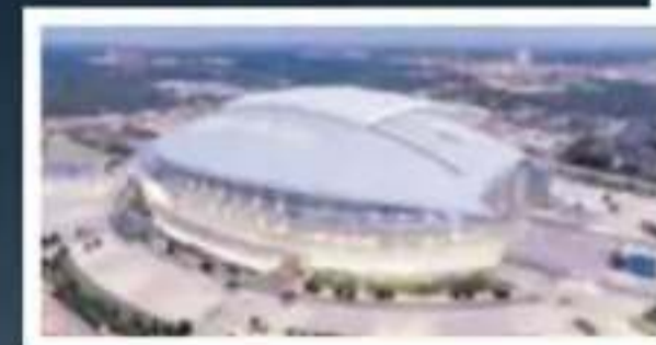
AT&T Stadium, Dallas Capacidad: 80.000