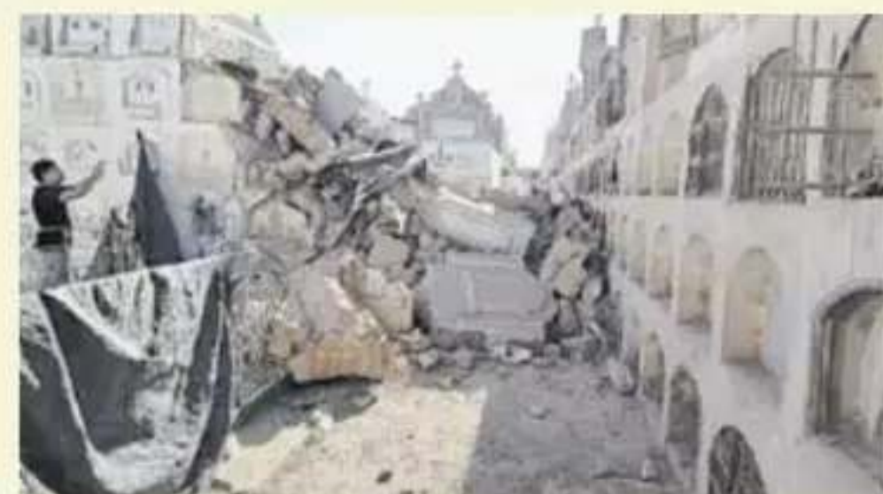
Cementerio de Ica sufrió graves daños.

Autoridades informaron que otra región del país también fue afectada con el sismo. En Huaytará, Huancavelica, se reportaron deslizamientos de piedras y una vivienda de adobe quedó inhabitable tras colapsar parcialmente.