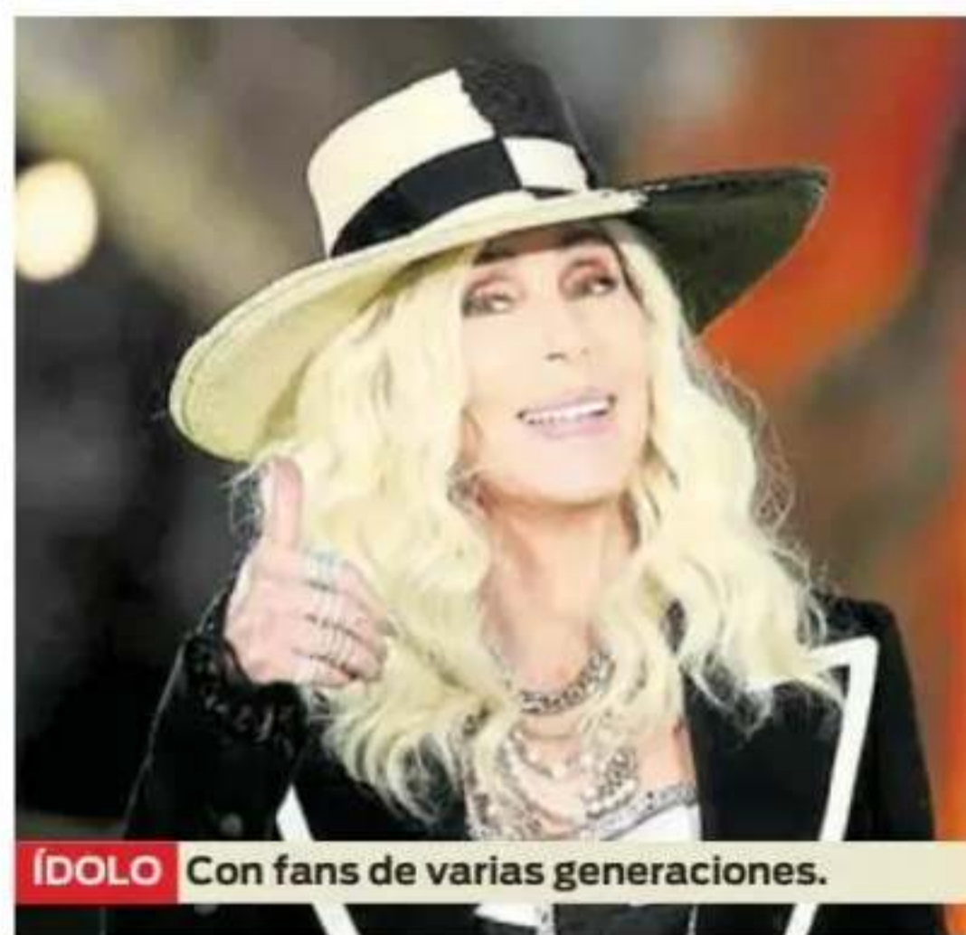
IDOLO Con fans de varias generaciones.

ESTILO. Cherilyn Sarkisian, su verdadero nombre, nació en El Centro, California, un 20 de mayo de 1946. Su vocación artística se manifestó a edad muy temprana: siendo