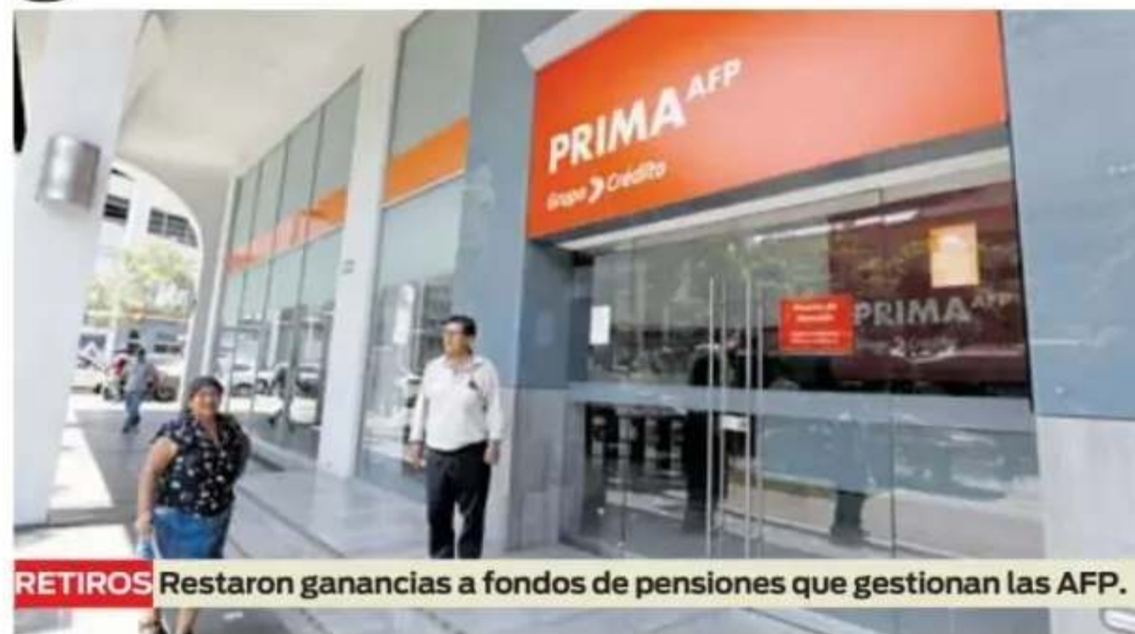
RETIROS Restaron ganancias a fondos de pensiones que gestionan las AFP.