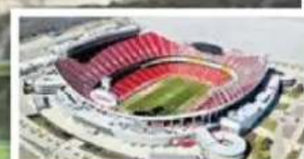
Arrowhead, Kansas City Capacidad: 76.416