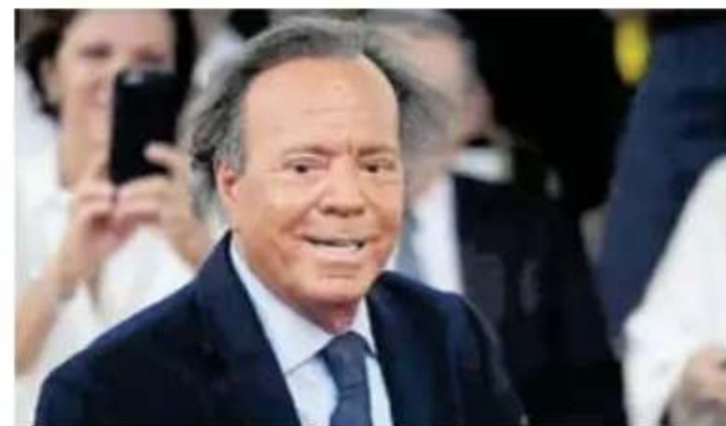
Cantante actualmente retirado de la música.

Cher, que se convirtió en una dupla que acaparó las listas de éxitos. Tras dejar el dúo y separarse del que también fue su esposo inició una carrera como solista que evolucionó hacia el pop, el rock, la música disco y la electrónica. Por "Hechizo de luna" (1987), que coprotagonizó con Nicolas Cage, se llevó el Oscar a la mejor actriz. Fue nominada al Oscar a la mejor actriz de reparto por su papel en "Silkwood" (1983), de Mike Nichols, y obtuvo el aplauso de la crítica por sus interpretaciones en "Máscara" (1985, de Peter Bogdanovich) y "Sospechoso" (1987, de Peter Yates).