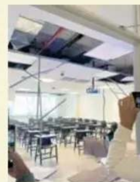
Caída de estructuras generó tensión.

12:57 p.m. ocurrió el movimiento telúrico. Una réplica de magnitud 4.1 se reportó a las 5:18 p.m.