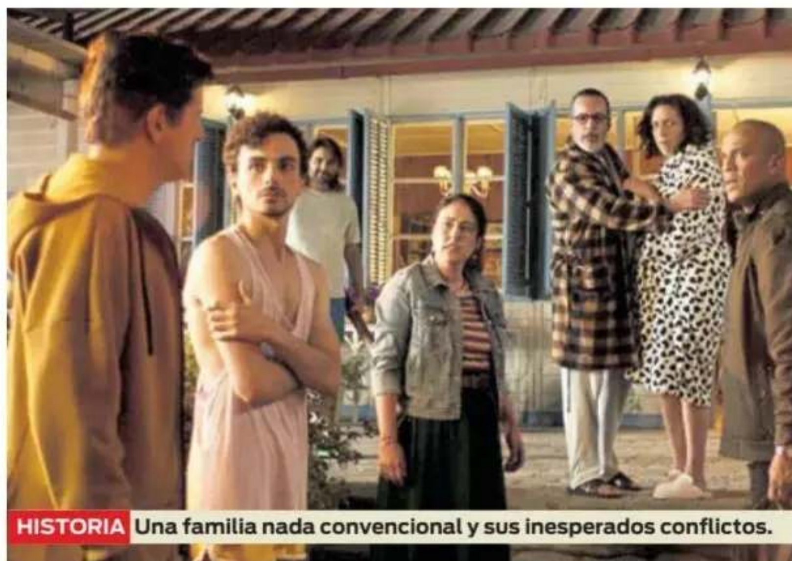
HISTORIA Una familia nada convencional y sus inesperados conflictos.