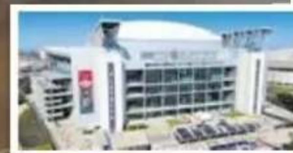
NRG Stadium, Houston Capacidad: 72.220